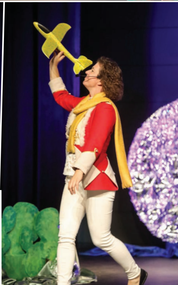
Przedstawienie „Mały Księżyc” przygotowane przez uczestników warsztatów teatralnych w ramach projektu Małopolski Uniwersytet Ludowy LOWE