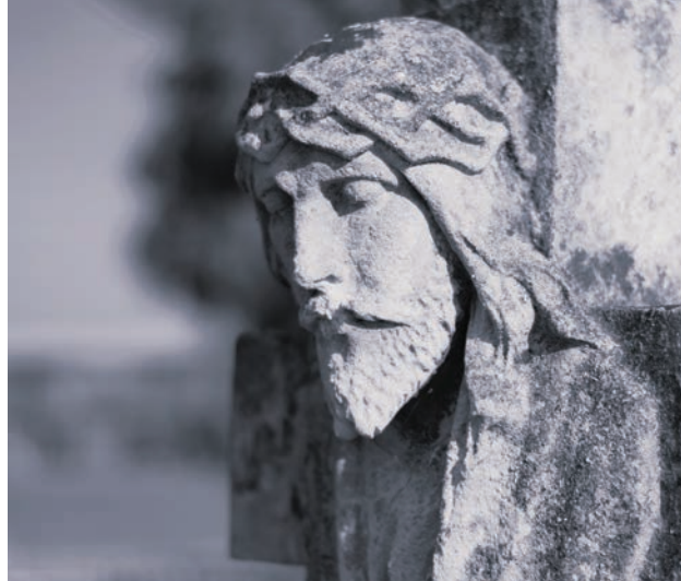
I miejsce. kategoria praca fotograficzna. Amelia Płachno (Uście Solne)