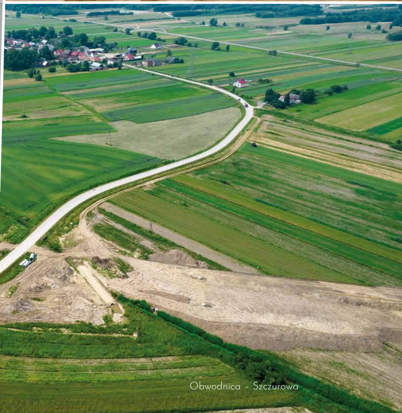
Obwodnica - Szczurowa