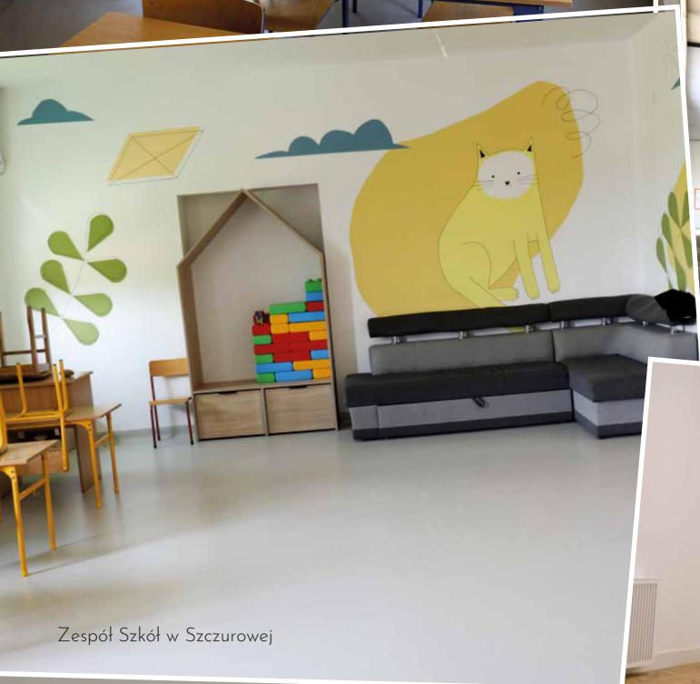
Zespół Szkół w Szczurowej