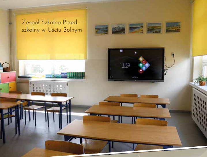
Zespół Szkolno-Przedszkolny w Uściu Solnym