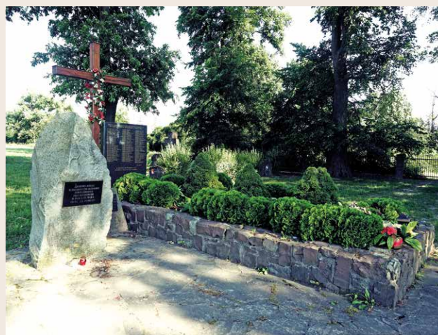
Mogiła zamordowanych bestialsko Romów znajdująca się na Cmentarzu Parafialnym w Szczurowej