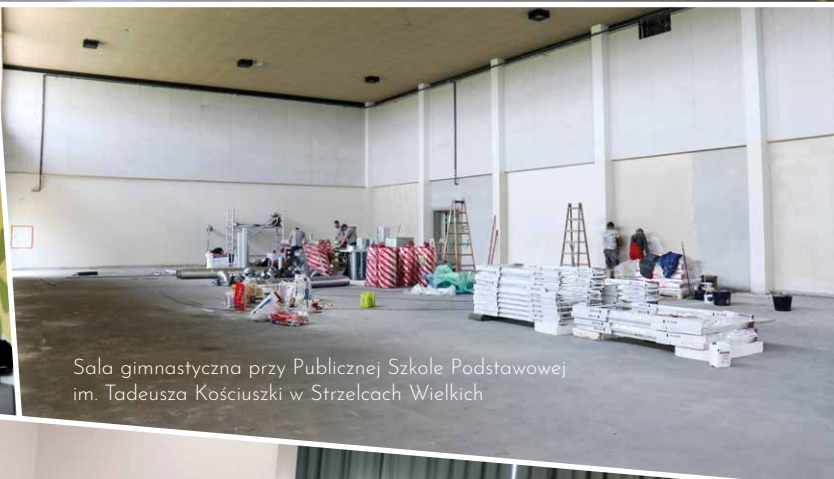
Sala gimnastyczna przy Publicznej Szkole Podstawowej im. Tadeusza Kościuszki w Strzelcach Wielkich