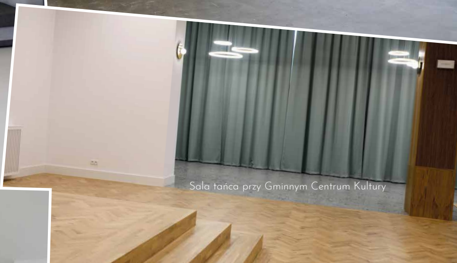
Sala tańca przy Gminnym Centrum Kultury