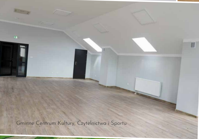
Gminne Centrum Kultury, Czytelnictwa i Sportu