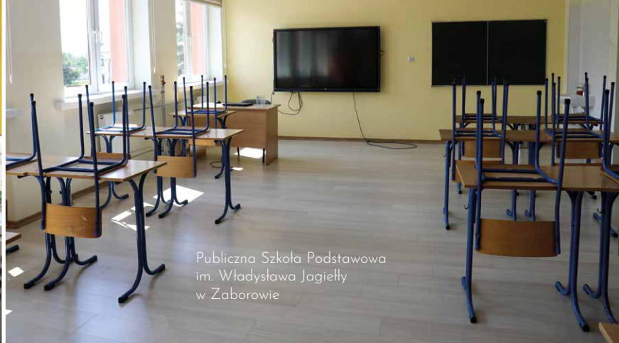
Publiczna Szkoła Podstawowa im. Władysława Jagiełły w Zaborowie